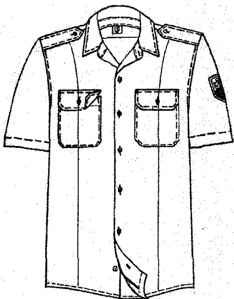
Фигура 1- Изглед предна част

Знакът за принадлежност към БА, „Наръкавна жакардова емблема „БА“ според род войска се пришива на левия ръкав, при разгънато положение по основния детайл. Центроването е по линия срещуположна на съединителния шев на ръкава, на разстояние 10,0 cm от горната част на емблемата до съединителния шев, прикачащ ръкава.