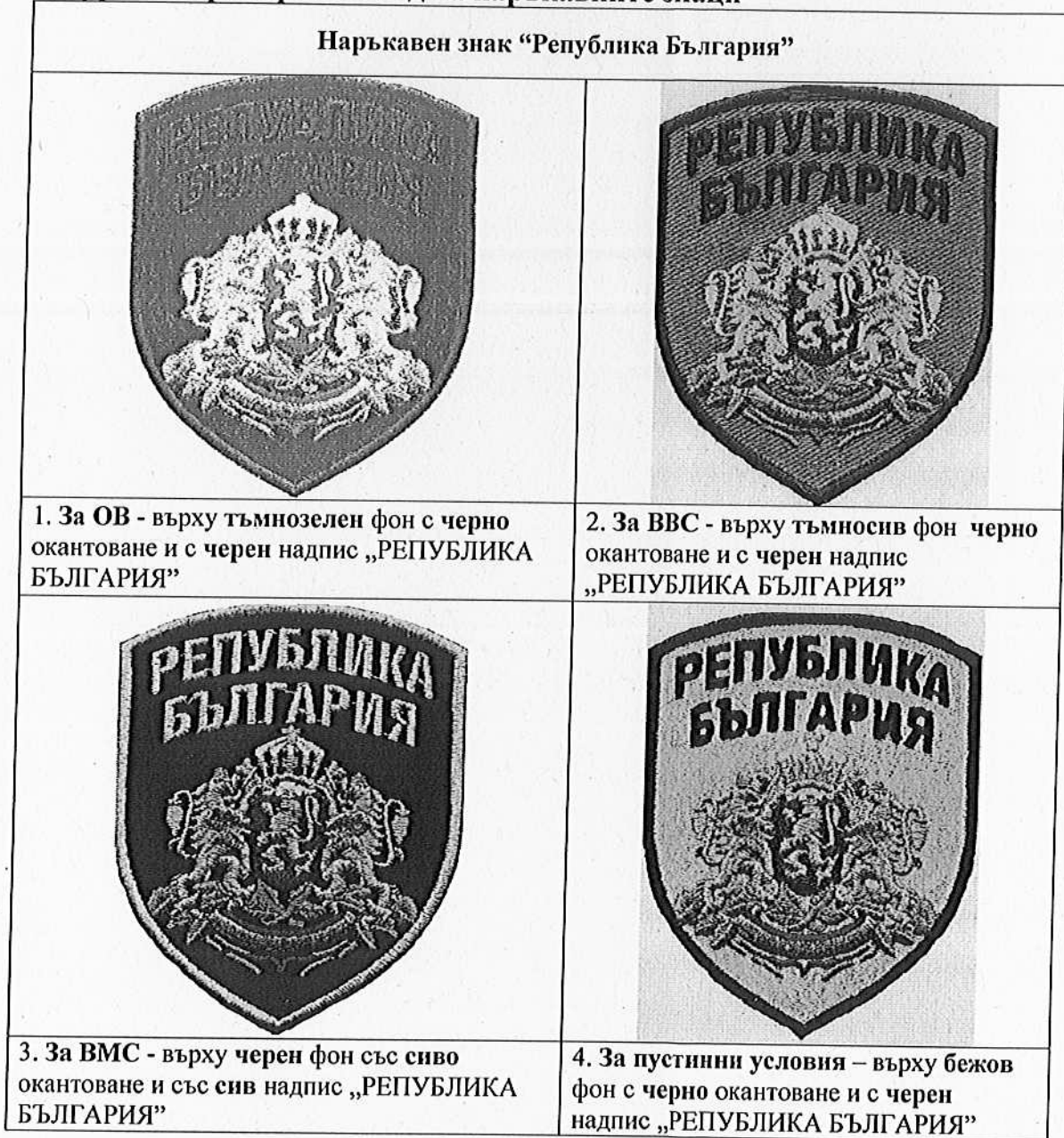
Фигура 4 – Примерен изглед на наръкавните знаци

Под основния плат, върху който се бродира, да се подлепва подложка от „нетъкан текстил” или еквивалентно/и. Закрепването на наръкавния знак към левия ръкав да е посредством пришиване, непосредствено в основата след бродирания обточващ кант на знака.